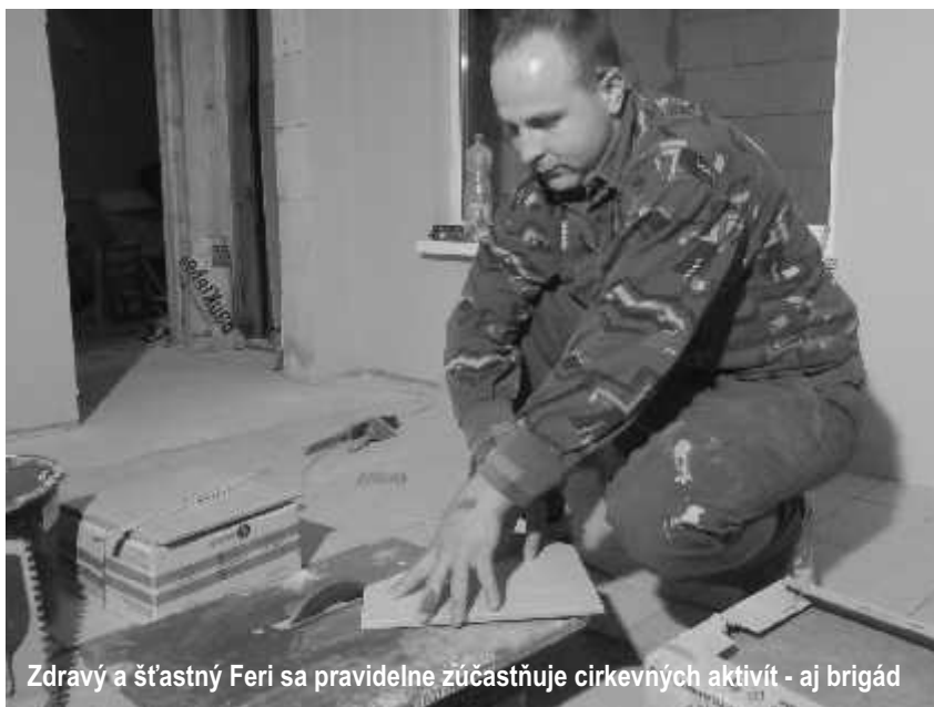
Zdravý a šťastný Feri sa pravidelne zúčastňuje cirkevných aktivít - aj brigád

rukách, bol som v bezpečí a nakoniec vďaka Jeho pomoci som vyhral nad zákernou chorobou.