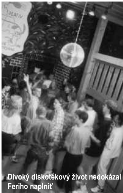
Divoký diskotékový život nedokázal Feriho naplniť

"Pozri sa, koľko je tu málo ľudí. Ja viem na diskotéke zabávať oveľa väčšie množstvo ľudí, ako tu vidíš,